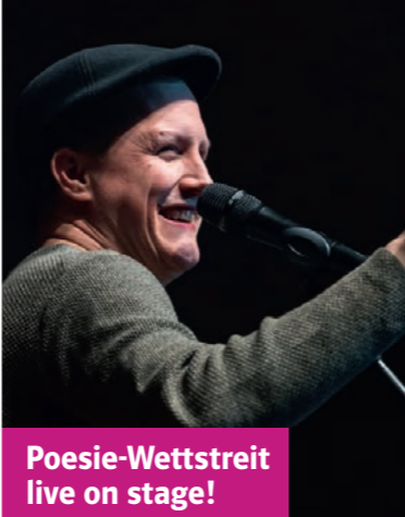
Poesie-Wettstreit live on stage!

Ihr Zauber, ihre Stimme, die energiegeladen in höchste Höhen schwingt, die weich und zärtlich, manchmal zerbrechlich, aber immer noch messerscharf den Raum durchschneiden kann, ist unverwechselbar. Hebräische Volklieder klingen neben irischen Balladen, europäisierter Orient neben dem gutturalen Schrei der Bronx, der intellektuelle Witz des Broadway neben sephardischen Traumphantasien. Ein einzigartiges Erlebnis! 29. Januar 2022 | 39,90 € und 59,90 € inkl. aller Gebühren