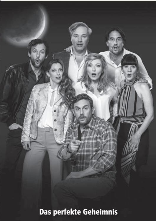
Das perfekte Geheimnis