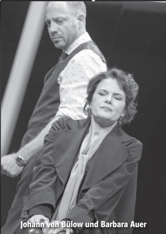
Johann von Bülow und Barbara Auer