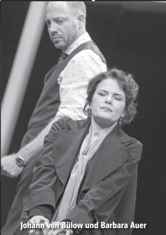
Johann von Bülow und Barbara Auer