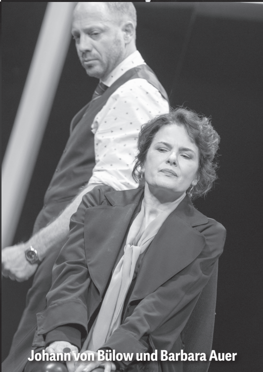
Johann von Bülow und Barbara Auer